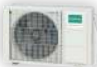
G-AOHH 7 à 14 KGCG